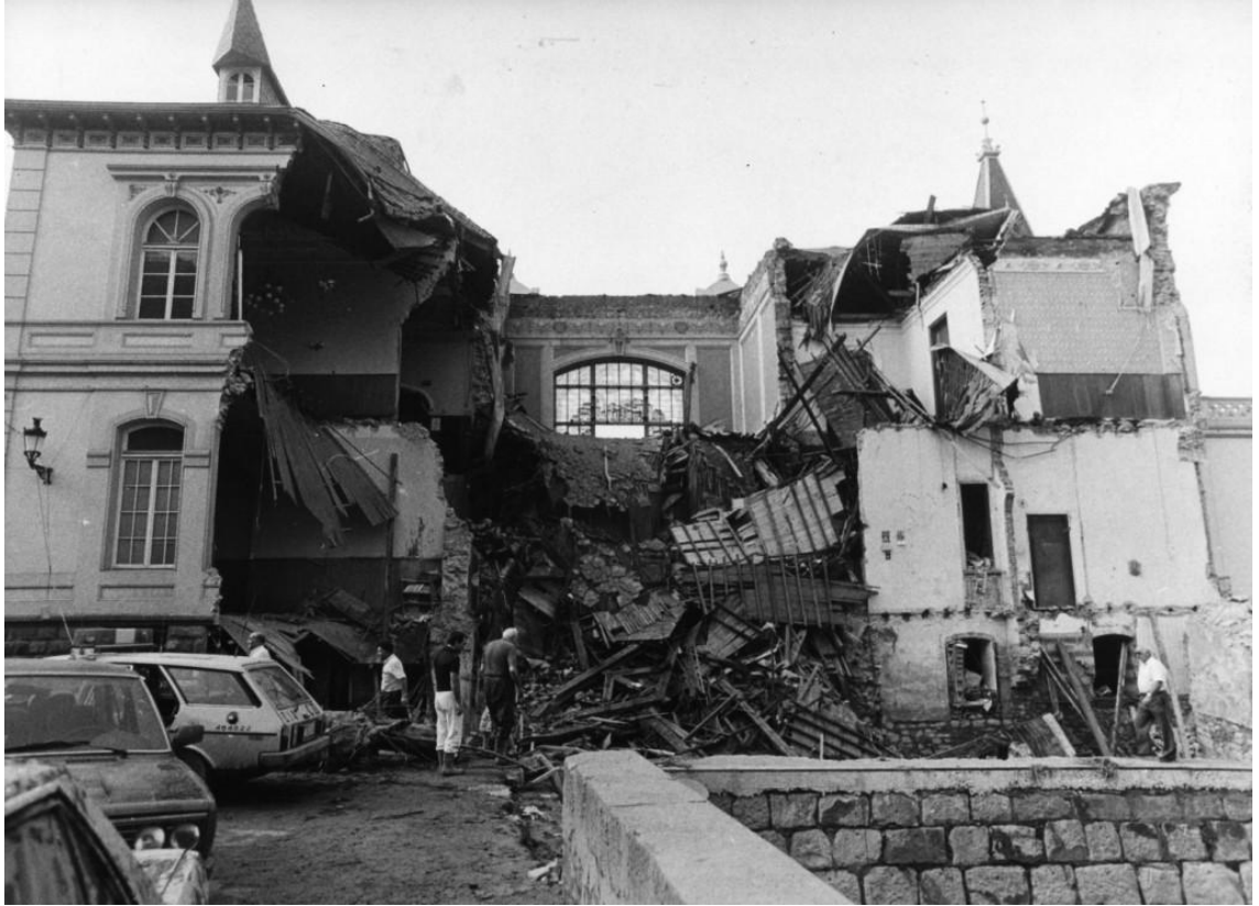
8.- Así quedó el casino de Bermeo tras las inundaciones de 1983.