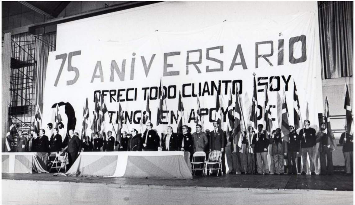
3.- Acto en La Casilla (Bilbao) en recuerdo de Sabino Arana en el 75 aniversario de su fallecimiento en Sukarrieta. Noviembre de 1978.