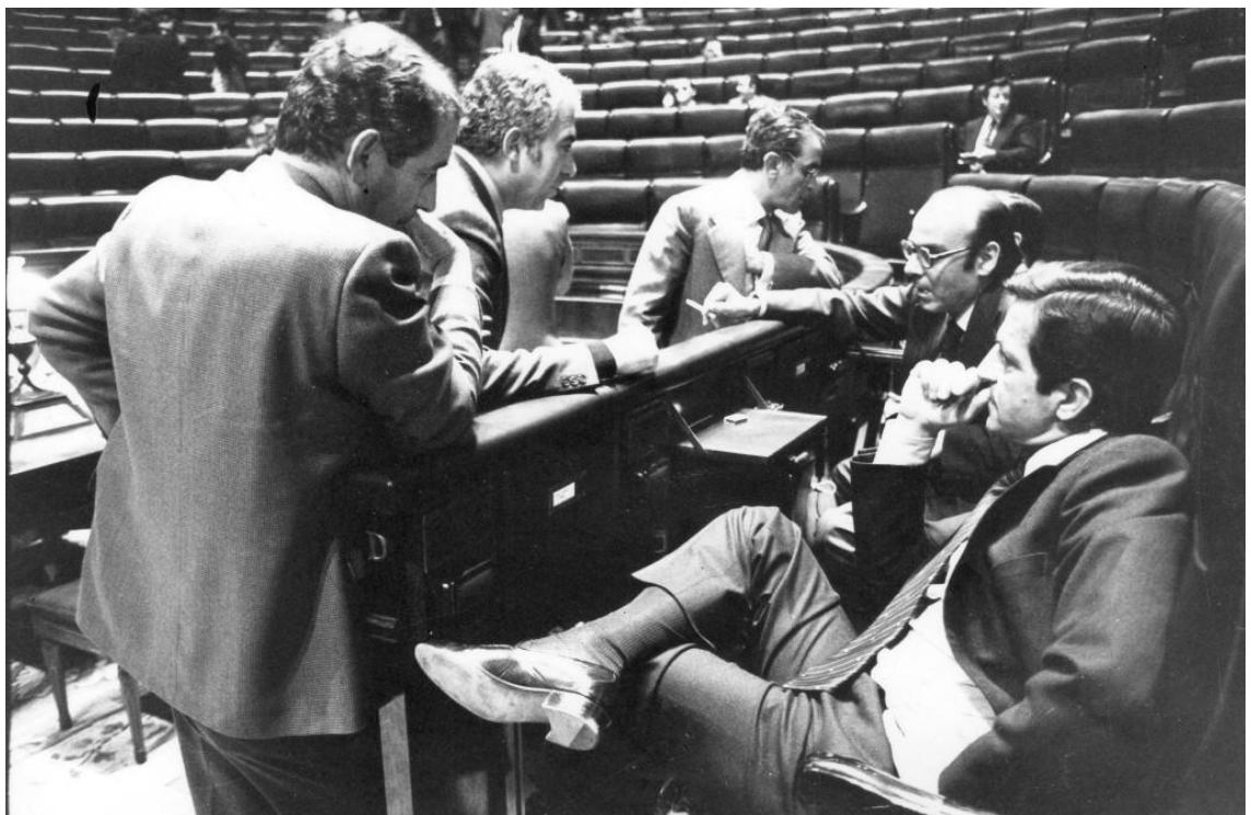
6.- Congreso de los Diputados. Adolfo Suárez con su vicepresidente Fernando Abril Martorell.