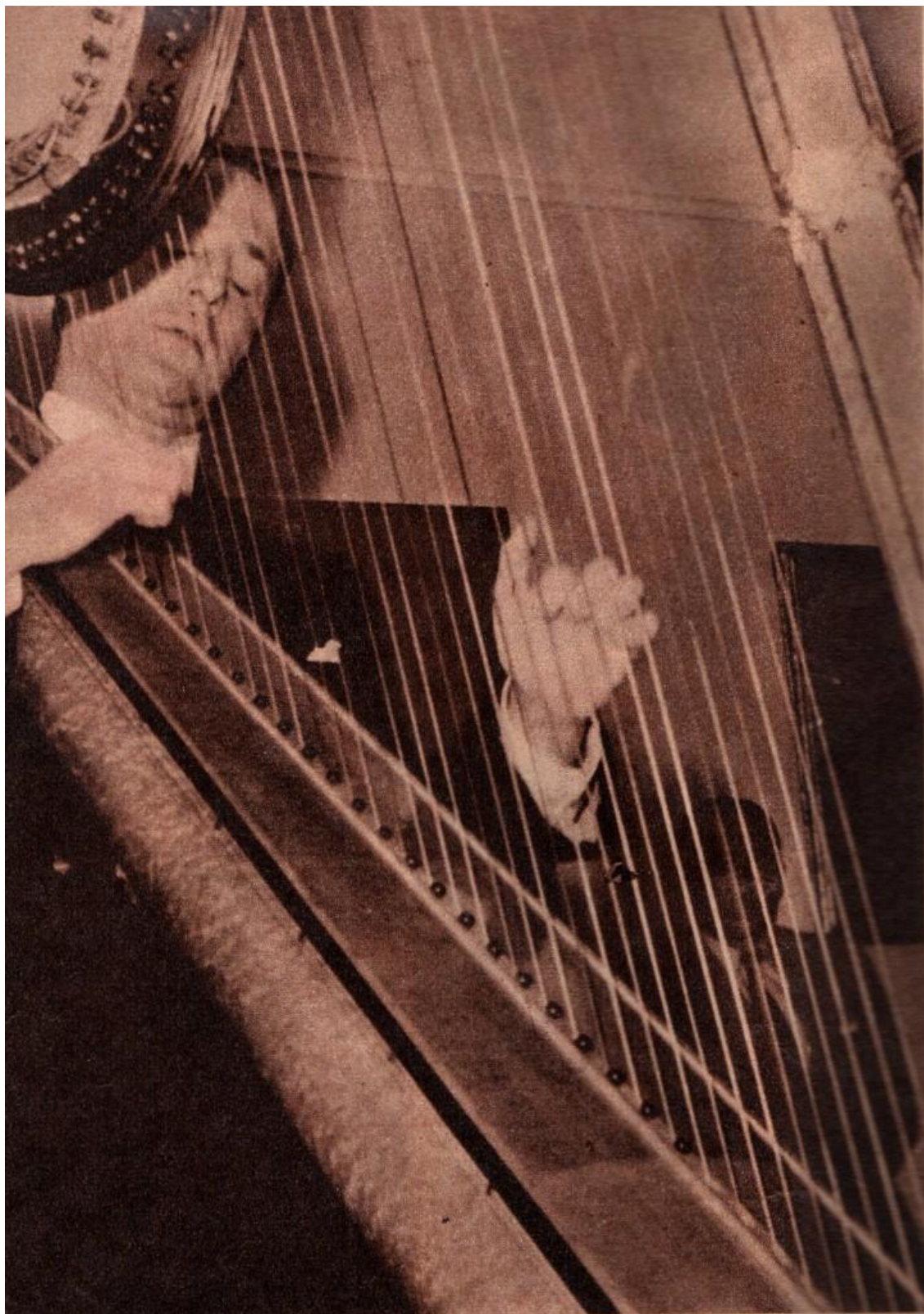
8.- El arpista de fama internacional Nicanor Zabaleta. Estuvo en la inauguración del Centro Vasco de Caracas, en Marzo de 1950.