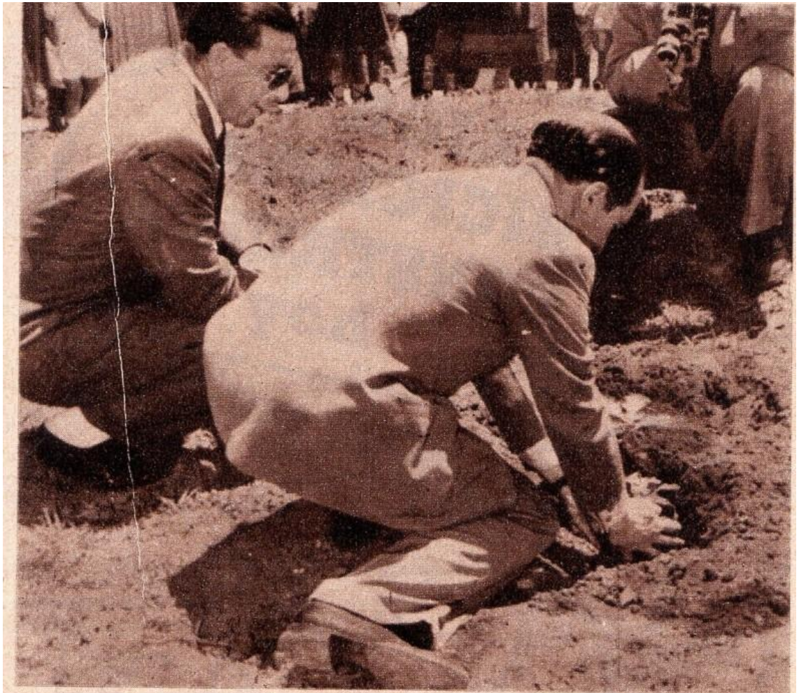
El Presidente del Gobierno Vasco planta un retoño del árbol de Guernika.