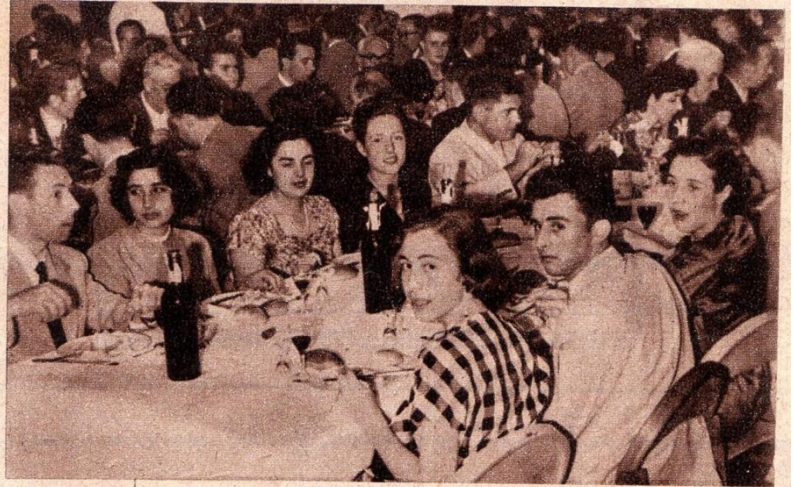
Aspecto general del banquete servido en los locales del Centro Vasco.